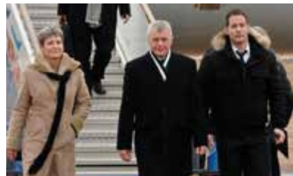
Thomas Pesquet, à droite sur la photo, en compagnie du Russe Oleg Novitsky et de l'Américaine Peggy Whitson, lors de son arrivée à Baïkonour (Kazakhstan).

cette pesante gravité dont Isaac Newton eut la révélation en voyant tomber une pomme vers le sol ! Dixième spationaute français envoyé dans l'espace, Thomas Pesquet restera six mois à bord de l'ISS en compagnie de Peggy et Oleg, avec un programme d'expériences scientifiques chargé. L'impact de la microgravité sur la musculature humaine figure notamment dans le cahier des charges du spationaute, ainsi que les modifications du système cardio-vasculaire ou encore la croissance osseuse dans ce milieu où le mot "poids" ne signifie plus rien ! Ce qui nous intéresse au plus haut point si nous voulons préparer demain des vols humains très longue durée – à destination de Mars, par exemple... ■