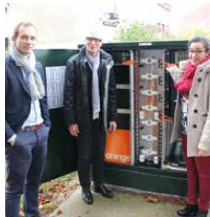
Vingt-trois armoires (photo) hébergent la fibre optique à Vernon. 800 foyers peuvent déjà bénéficier de la fibre optique.

Orange est le seul déployeur et aménageur de cette technologie, et pour l'instant le seul à la commercialiser à Vernon. Tous ces équipements ne coûteront rien au contribuable ; c'est Orange qui prend en charge la totalité des investissements. Hébergé à côté de La Poste, le central télé-