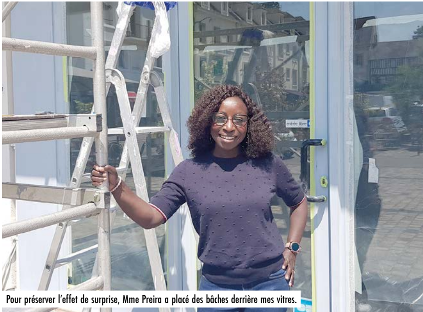
Pour préserver l'effet de surprise, Mme Preira a placé des bâches derrière mes vitres.

➔ 200€ en bons d'achat remportés à utiliser au choix dans cette même liste ou dans un magasin adhérent !