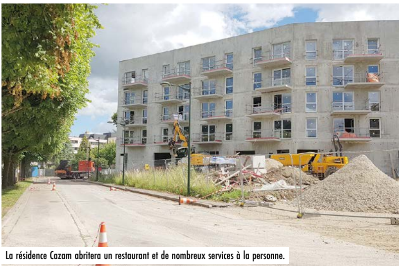
La résidence Cazam abritera un restaurant et de nombreux services à la personne.

Le 20 juin, un chantier d'un mois a débuté dans ce quartier. Il consiste en la sécurisation des arrêts de bus avec marquage au sol, une signalisation lumineuse et une réfection des trottoirs. Coût : 47 000 €. Au total, 72 000 € auront été investis pour sécuriser Ma Campagne.