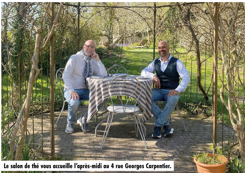
Le salon de thé vous accueille l'après-midi au 4 rue Georges Carpentier.