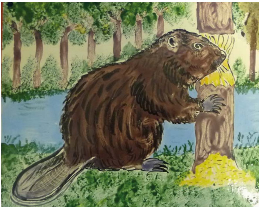
Les 11 familles des Castors vernonnais ont reçu cette plaque émaillée destinée à être apposée sur les façades des différentes maisons. Mais peu de plaques ont été posées.

Ce mouvement d'auto-construction coopérative naît après la seconde guerre mondiale. Il se développe à l'échelle nationale lors de la Reconstruction et s'inscrit dans le contexte de la crise du logement. En 1950, il s'organise au sein de l'Union Nationale des Castors dont les statuts sont approuvés un an plus tard. L'idéal visé est avant tout d'être propriétaire d'un pavillon. Pour y parvenir, les castors mettent alors en commun ressources financières et techniques. ■