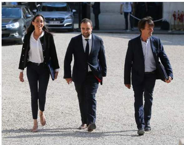
Brune Poirson, Sébastien Lecornu et Nicolas Hulot au pied des marches de l'Elysée.