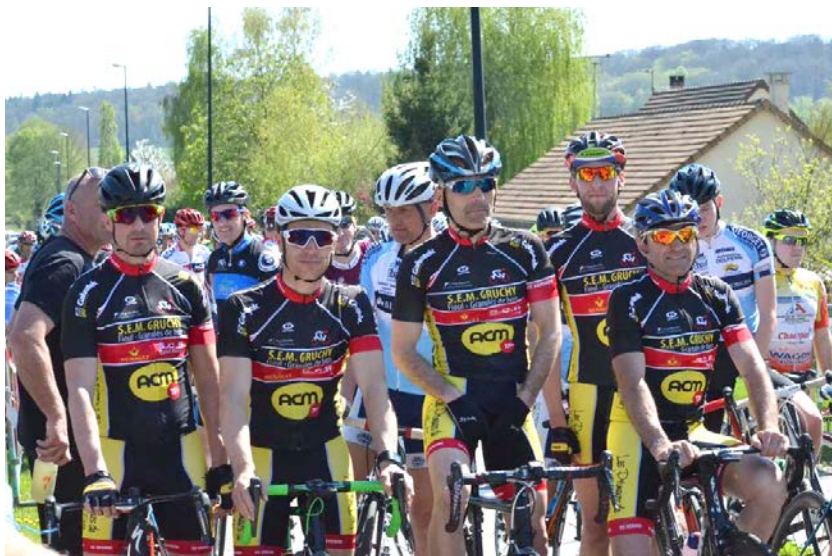
Jusque-là pour l'année 2017, le VC Vernonnais a remporté quinze victoires lors des compétitions.

Une fois la semaine achevée, nombre d'entre eux se retrouve en compétition sur les routes normandes et même parfois au-delà de la région. Le Vélo Club Vernonnais dispose d'un mini bus lui permettant de faciliter le déplacement des cyclistes.