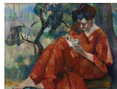
Henri Manguin, La Couseuse à la robe rouge , 1907.