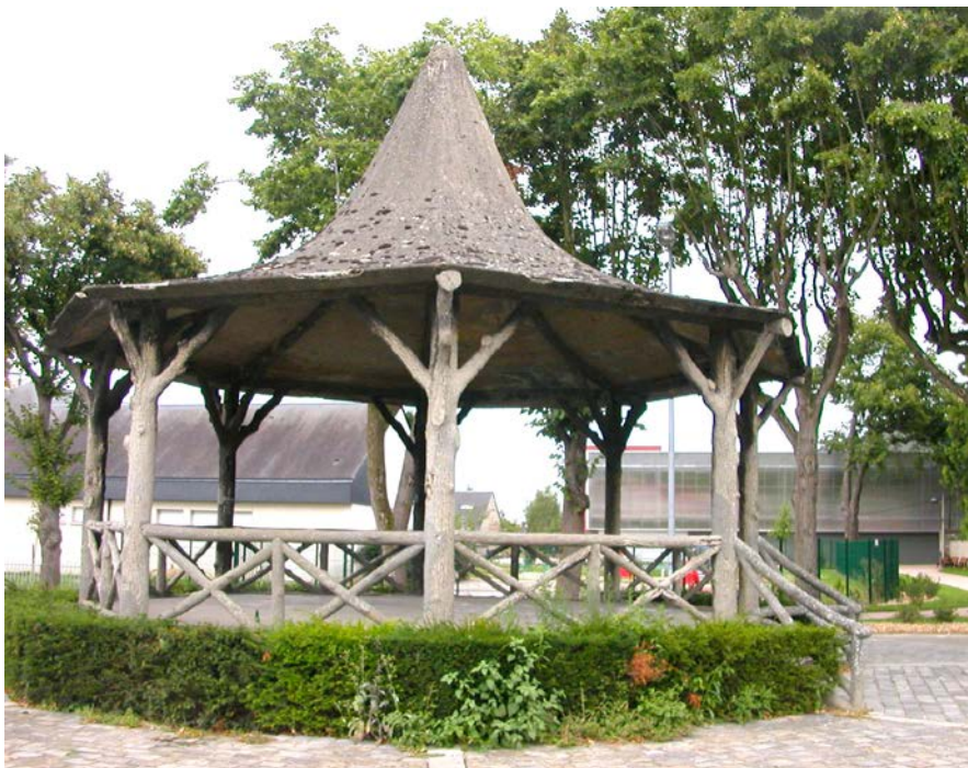
Depuis presque cent ans, le kiosque fait parti du paysage vernonnais.

Le 7 mars 1923, le conseil municipal se déplace sur la place de la République